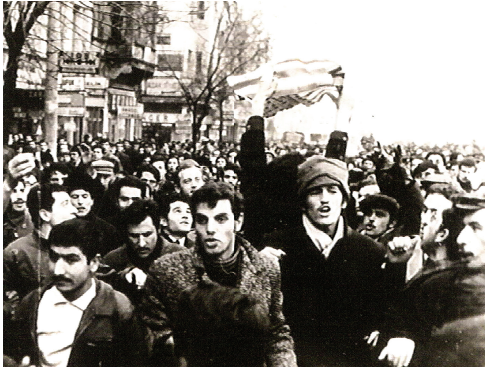
Gençlik birçok farklı taleple meydanlardaydı. Özel okulların devletleştirilmesi, 6. Filo ve eğitim derken süreç giderek daha politik talepleri beraberinde getiriyordu