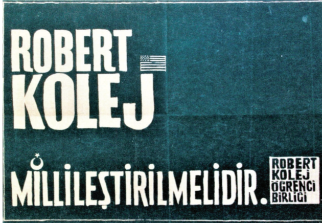
Afiş tasarımı: Tan Oral

50 yıl önce de Boğaziçililer meydanlardaydı