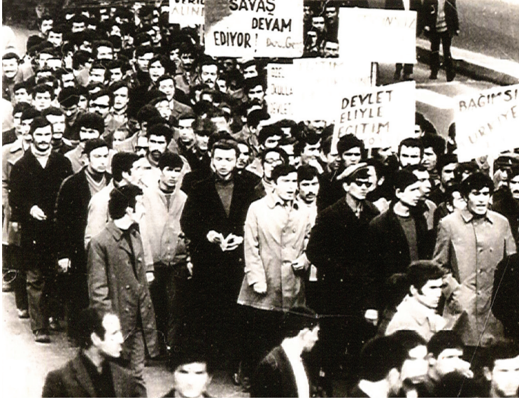
Özel yüksekokul öğrencilerine İTÜ yurtlarının tahsis edilmesi tepki çekiyordu

vererek özel okula gidebiliyorlar, ikamet olanaklarını da kendileri yaratmalı” diyorlardı. Sonunda İTÜ öğrencileri, yurt yönetimine fiilen el koyup yurdu işgal etti. ÖYO sorunu birden özellikle İTÜ öğrencilerinin en önemli sorunu hâline geliverdi.